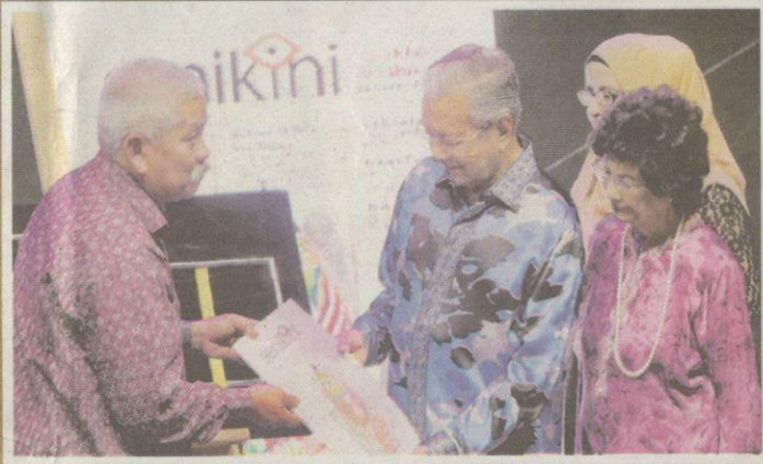
PERDANA Menteri, Tun Dr. Mahathir Mohamad (dua dari kanan) ketika merasmikan Sambutan 60 Tahun Balai Seni di Kuala Lumpur baru-baru ini.

HOTEL MAJESTIC pernah menjadi bangunan Balai Seni Negara pada tahun 1984.