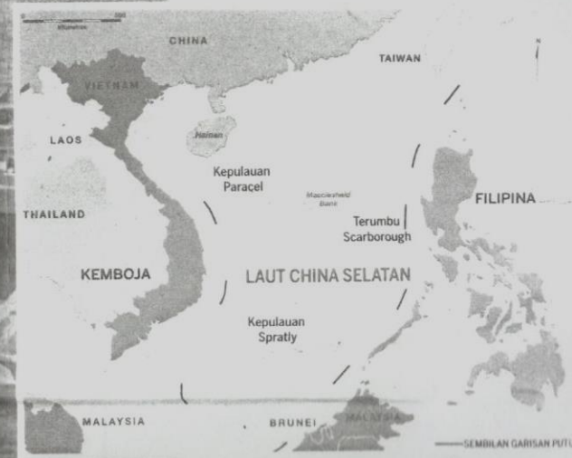
PETA Laut China Selatan. Garis putus-putus menunjukkan kawasan yang dituntut oleh China.

LAUT China Selatan menjangkau keluasan dua juta kilometer persegi di Lautan Pasifik meliputi kawasan dari Singapura dan Selat Melaka sehinggalah ke Selat Taiwan termasuk perairan Filipina, utara Indonesia dan timur Vietnam.