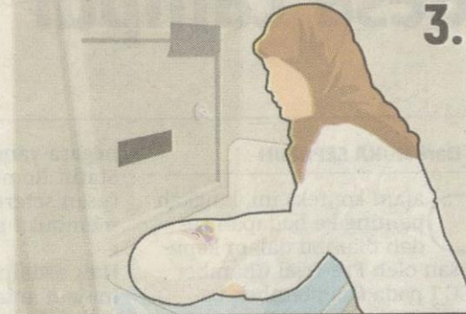
Peti dilengkapi pendingin hawa, tilam, lampu kamera litar tertutup (CCTV) termasuk sensor berat badan yang akan mengaktifkan penggera supaya penjaga pusat berkenaan mengetahui ada bayi diletakkan di dalam peti itu.