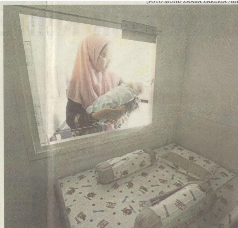
Kakitangan OrphanCARE menunjukkan cara meletakkan bayi di Baby Hatch.