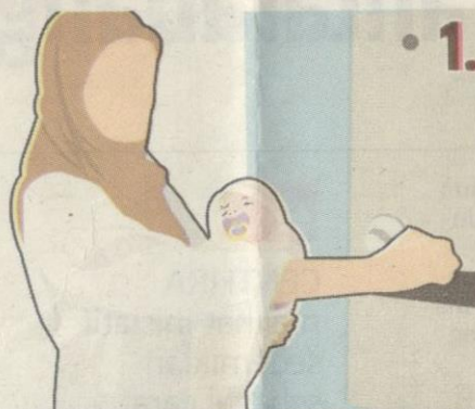
Pintu peti dibuka untuk meletakkan bayi.