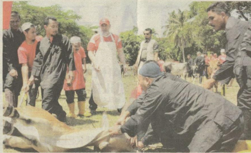
Baginda berkenan menyempurnakan penyembelihan lembu bersama rakyat di Panji Ogos lalu.

Menyentuh mengenai pendidikan pula, Baginda mendapat pendidikan awal