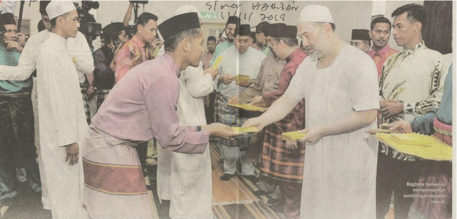
Baginda berkenan menyampaikan sumbangan kepada rakyat.