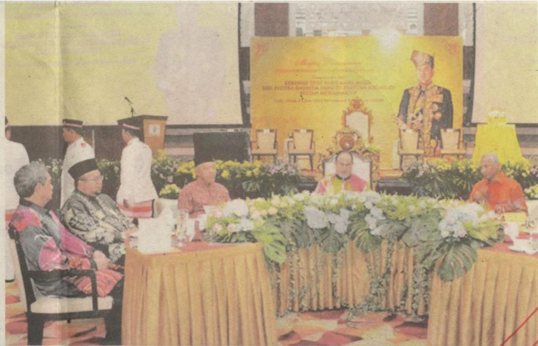
Baginda menghadiri majlis yang memberi tumpuan kepada pertanian.