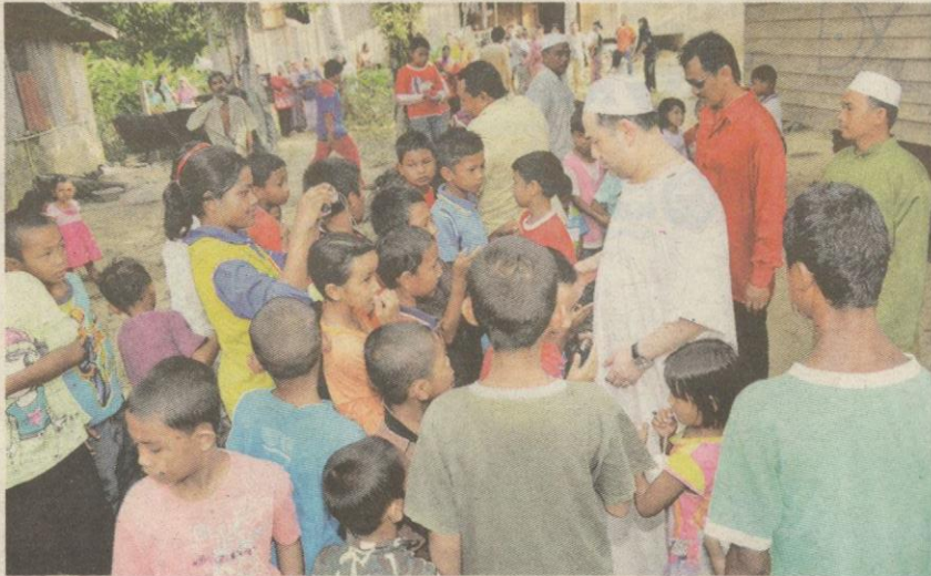
Mengimbuu ketika Baginda sebelum dilantik sebagai Yang di-Pertuan Agong lagi sentiasa selesa mendampingi pelbagai peringkat masyarakat.

Turut menyentuh hati rakyat apabila, Sultan Muhammad V juga bersetuju memotong gaji dan emolumen sendiri sebanyak 10 peratus sepanjang tempoh pemerintahannya sebagai Yang di-Pertuan