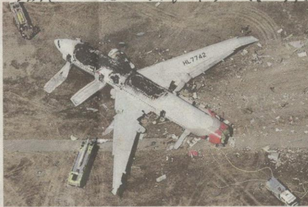
Sesetengah syarikat penerbangan dikatakan tidak mematuhi piawaian antarabangsa.

Pentadbiran Penerbangan Persekutuan yang mengendalikan Program Penilaian Keselamatan Penerbangan Antarabangsa atau IASA adalah untuk memastikan syarikat penerbangan mematuhi standard ditetapkan Pertubuhan