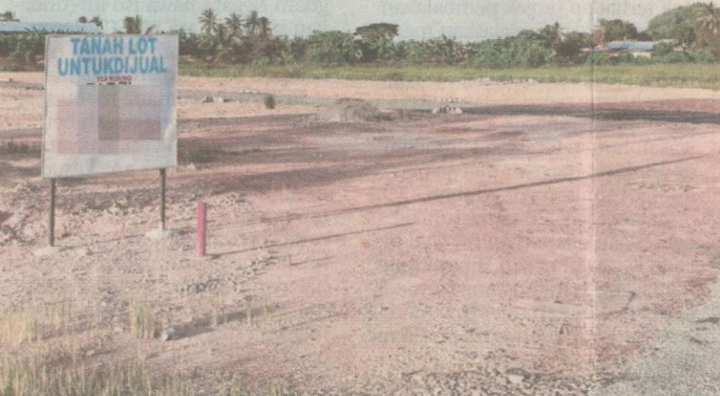
Tinjauan mendapati ada sawah dijadikan kawasan perumahan dan projek pembangunan di sekitar Alor Setar

→ Industri padi kritikal, pelbagai masalah jejas pengeluaran pesawah