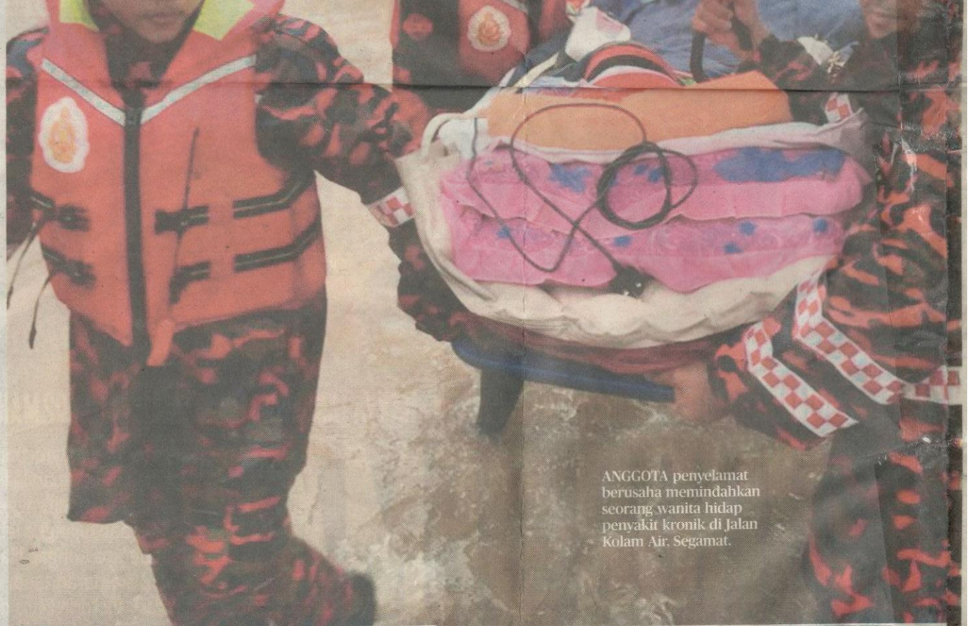
ANGGOTA penyelamat berusaha memindahkan seorang wanita hidap penyakit kronik di Jalan Kolang Air, Segamat.