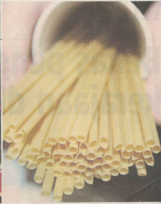
Penyedut minuman daripada hampas tebu dan diimport dari Taiwan antara alternatif menggantikan straw plastik.

Pengurus cawangan restoran terbabit, K Siva, berkata pihaknya memulakan kempen itu sejak lebih sebulan lalu, dengan tidak menyediakan penyedut minuman, kecuali