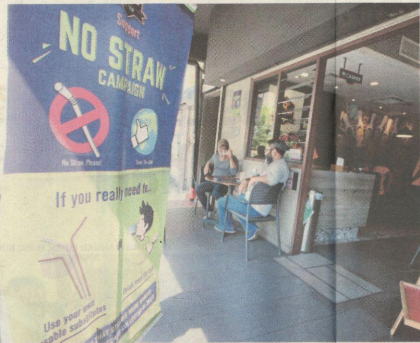
Pengusaha restoran mengambil inisiatif meletakkan gantungan dan pelekat 'Kempen Tiada Penyedut Minuman' di sekeliling premis ketika tinjauan di sekitar Bangsar, semalam.