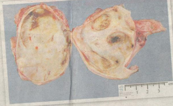
OVARIAN cyst jenis endometriotic .