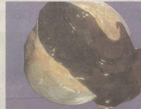
CYST berwarna coklat.