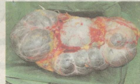
CONTOH cyst pada ovari.