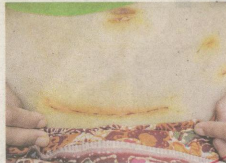
LUKA dari pembedahan.