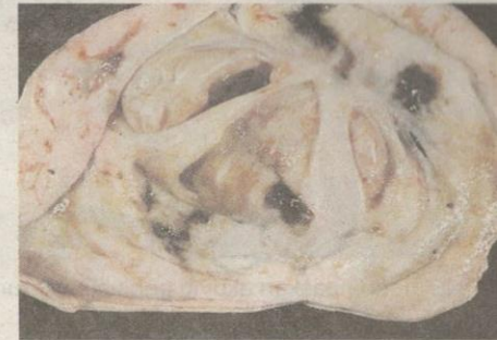
CYST boleh berubah kepada warna coklat gelap.