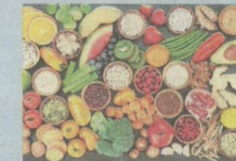
PENGAMBILAN makanan berserat tinggi yang banyak dapat melindungi usus.