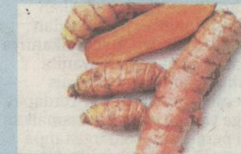
PENGAMBILAN kunyit dapat menghalang pembentukan sel-sel kanser.