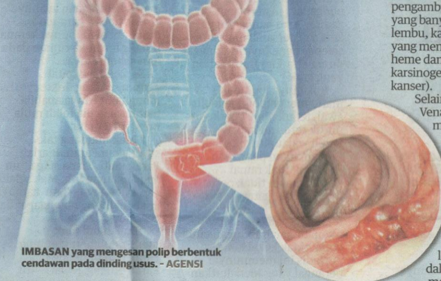
IMBASAN yang mengesan polip berbentuk cendawan pada dinding usus.

“Kebanyakan penghidap kanser kolon dalam kalangan kaum Cina di negara ini