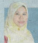
Oleh MARZITA ABDULLAH