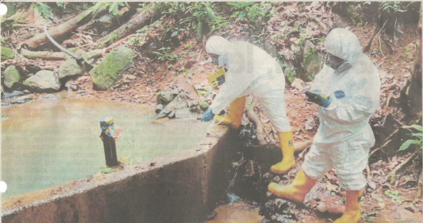
Anggota HAZMAT mengambil sampel air di beberapa kawasan sekitar Kuala Koh, Gua Musang.