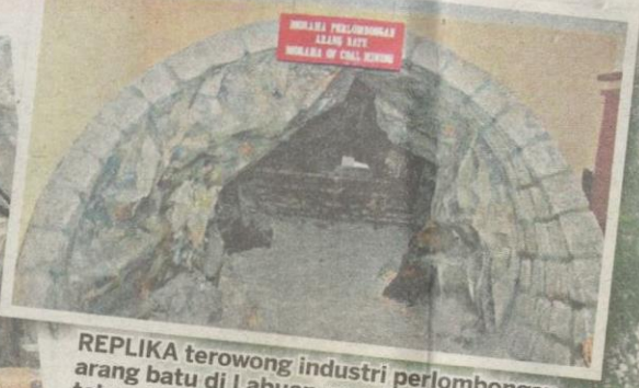
REPLIKA terowong industri perlombongan arang batu di Labuan yang bermula pada tahun 1847.