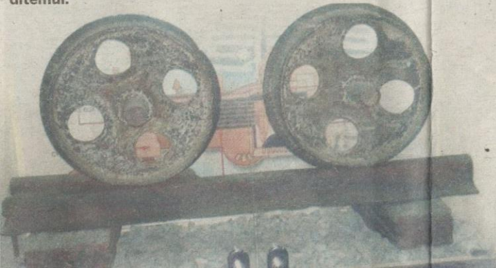
ANTARA roda dan rel kereta api yang berjaya ditemui.

Pada tahun 2015, Wilayah Persekutuan Labuan mempunyai 96,800 penduduk