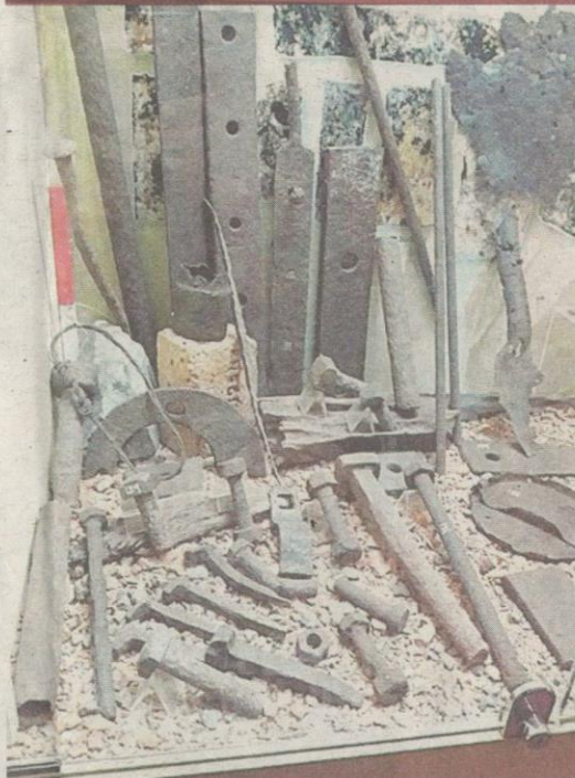
PERALATAN lama yang digunakan untuk melombong arang batu.

dapat disiapkan dua tahun kemudiannya kerana proses kerja yang rumit agar keaslian terpelihara.