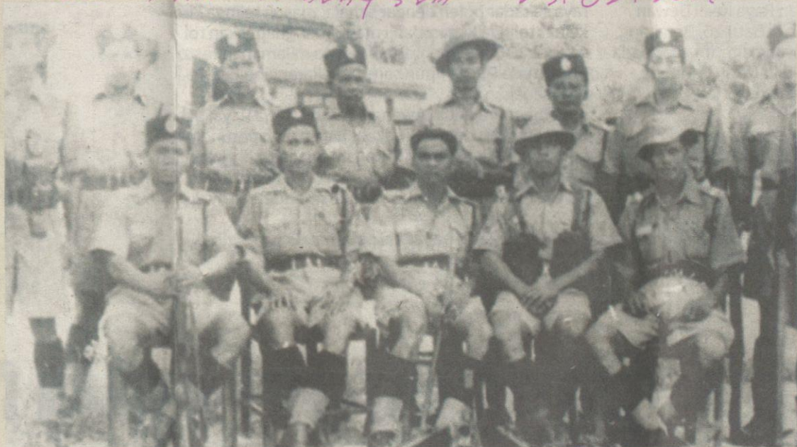
ANGGOTA-ANGGOTA polis yang diserang pegganas komunis di Balai Polis Bukit Kepong pada 1950.

Peristiwa hitam yang berlaku kira-kira 69 tahun lalu itu terpahat sebagai kemuncak kekejaman pegganas komunis di Tanah Melayu yang bertujuan membalas dendam terhadap pasukan keselamatan yang telah membunuh ramai anggota mereka sejak perintah Darurat diisytiharkan pada tahun 1948.