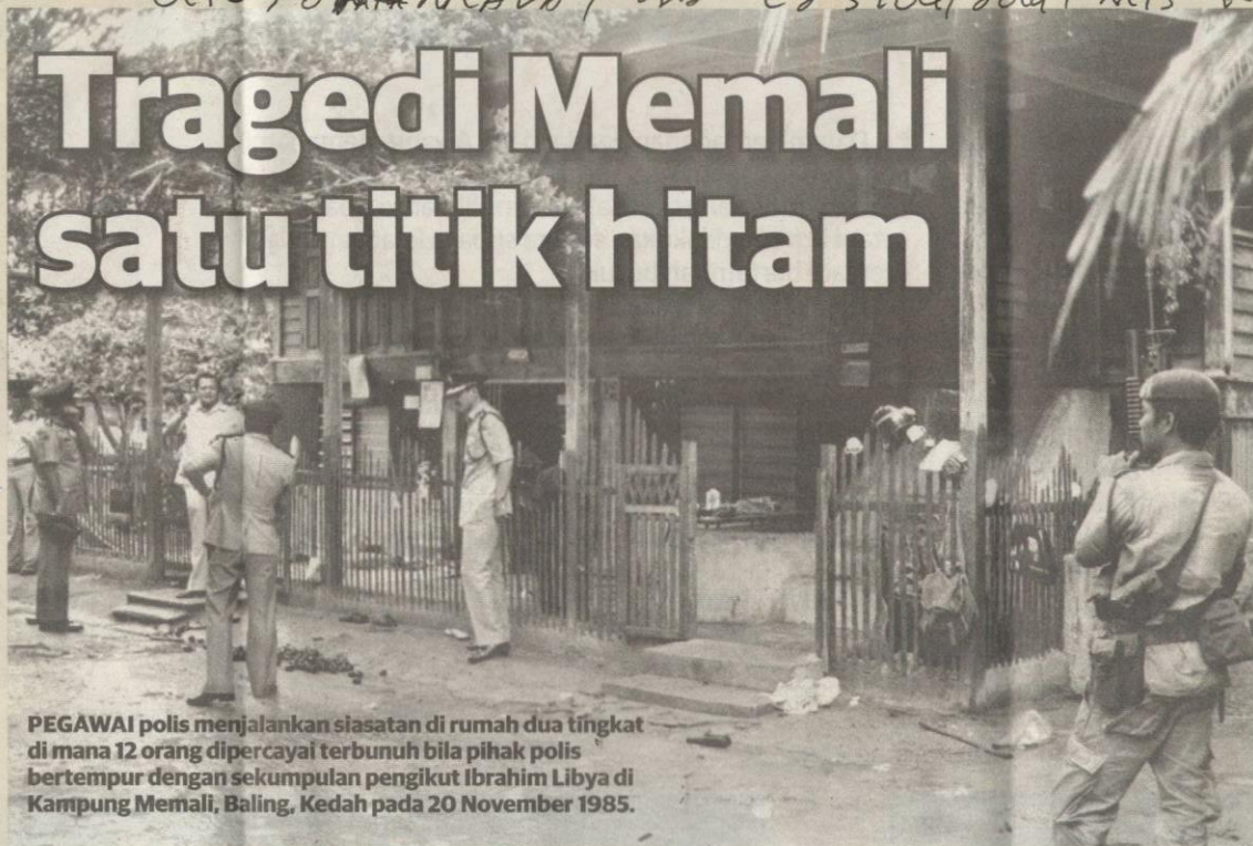
PEGAWAI polis menjalankan siasatan di rumah dua tingkat di mana 12 orang dipercayai terbunuh bila pihak polis bertempur dengan sekumpulan pengikut Ibrahim Libya di Kampung Memali, Baling, Kedah pada 20 November 1985.