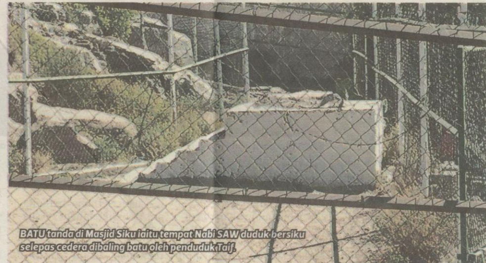
BATU tanda di Masjid Siku iaitu tempat Nabi SAW duduk bersiku selepas cedera dibaling batu oleh penduduk Taif.

air ketika hendak menaiki haji atau umrah.