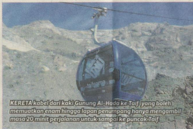
KERETA kabel dari kaki Gunung Al-Hada ke Taif yang boleh memuatkan enam hingga lapan penumpang hanya mengambil masa 20 minit perjalanan untuk sampai ke puncak Taif.

Kini, terdapat satu lagi cara untuk sampai ke puncak Al-Hada iaitu dengan menaiki kereta kabel.