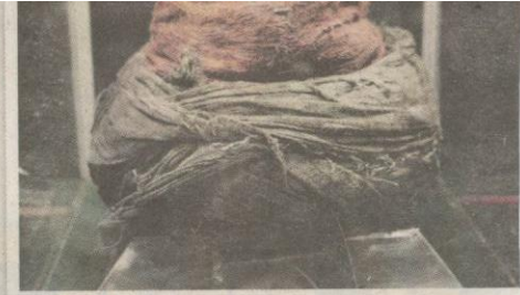
SERBAN Nabi Muhammad SAW berwarna hitam dan hijau yang dipamerkan pada Pameran Artifak Rasulullah SAW dan Para Sahabat RA.

Az Safra disimpan di dalam kotak kaca yang sama dengan pedang Al Ma'thur kerana ia barangan kepunyaan Nabi Muhammad SAW.