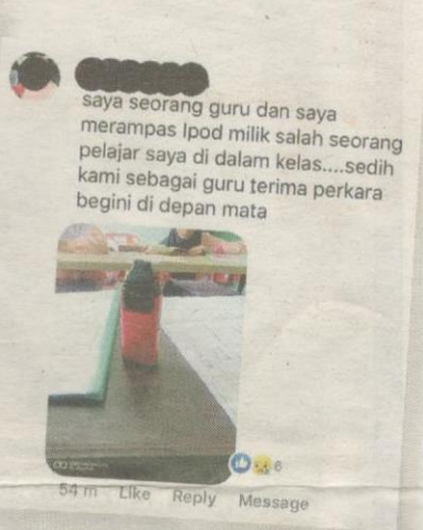
KELUHAN netizen di media sosial berhubung isu vape melibatkan pelajar sekolah.

hanya mahu dikenali sebagai Sham turut mengakui masalah itu bukan sahaja melibatkan pelajar sekolah menengah dan murid sekolah rendah malah pelajar perempuan turut terjebak dengan perbuatan tersebut.