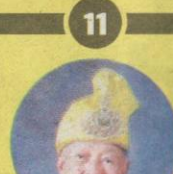
11 Seri Paduka Baginda Yang di-Pertuan Agong Almarhum Sultan Salahuddin Abdul Aziz Shah Alhaj Almarhum Sultan Hisamuddin Alam Shah Alhaj SELANGOR 26 April 1999 hingga 21 November 2001