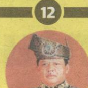
12 Seri Paduka Baginda Yang di-Pertuan Agong Tuanku Syed Sirajuddin Al-Marhum Tuanku Syed Putra Jamalullail PERLIS 13 Disember 2001 hingga 12 Disember 2006