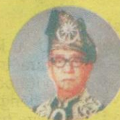
4 Seri Paduka Baginda Yang di-Pertuan Agong Almarhum Sultan Ismail Nasiruddin Shah Almarhum Sultan Zainal Abidin TERENGGANU 21 September 1965 hingga 20 September 1970