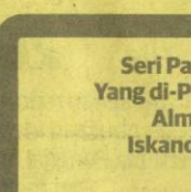
8 Seri Paduka Baginda Yang di-Pertuan Agong Almarhum Sultan Iskandar Almarhum Sultan Ismail JOHOR 26 April 1984 hingga 25 April 1989