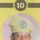
10 Seri Paduka Baginda Yang di-Pertuan Agong Almarhum Tuanku Ja'afar Almarhum Tuanku Abdul Rahman NEGERI SEMBILAN 26 April 1994 hingga 25 April 1999