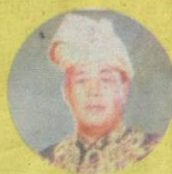
3 Seri Paduka Baginda Yang di-Pertuan Agong Almarhum Tuanku Syed Putra Alhaj Almarhum Syed Hassan Jamalullail PERLIS 21 September 1960 hingga 20 September 1965