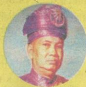
2 Seri Paduka Baginda Yang di-Pertuan Agong Almarhum Sultan Hisamuddin Alam Shah Almarhum Sultan Alaidin Sulaiman Shah SELANGOR 14 April 1960 hingga 01.September 1960