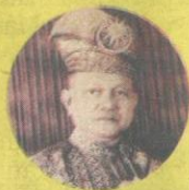
1 Seri Paduka Baginda Yang di-Pertuan Agong Almarhum Tuanku Abdul Rahman Almarhum Tuanku Muhammad NEGERI SEMBILAN 31.Ogos 1957 hingga 01 April 1960