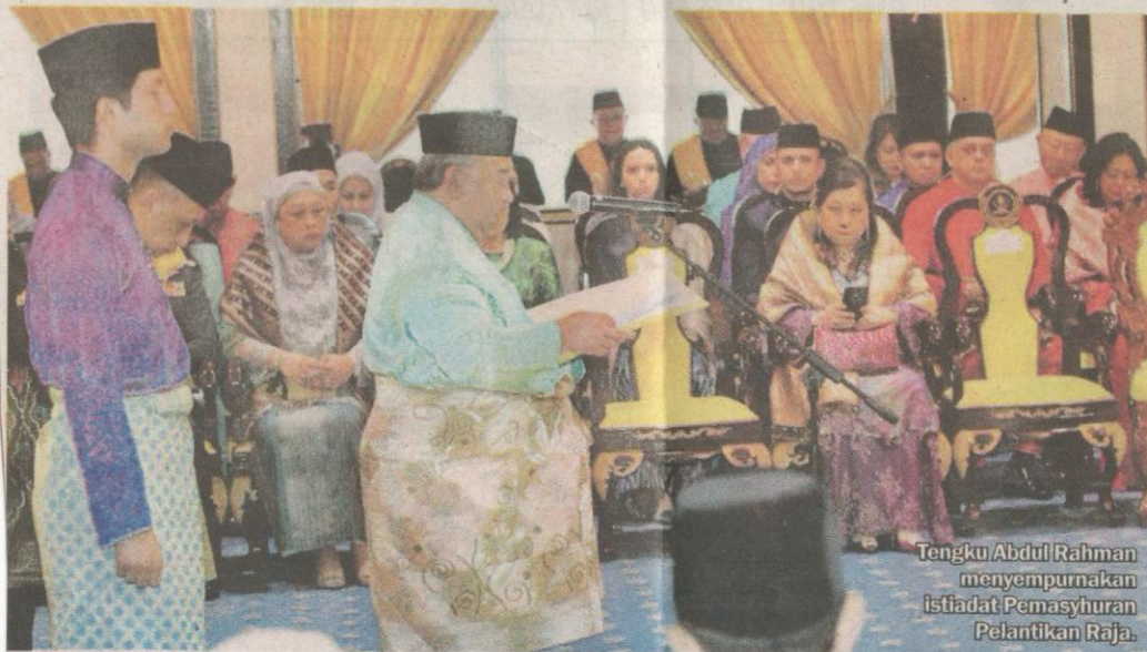
Tengku Abdul Rahman menyempurnakan istiadat Pemasyuhuran Pelantikan Raja.