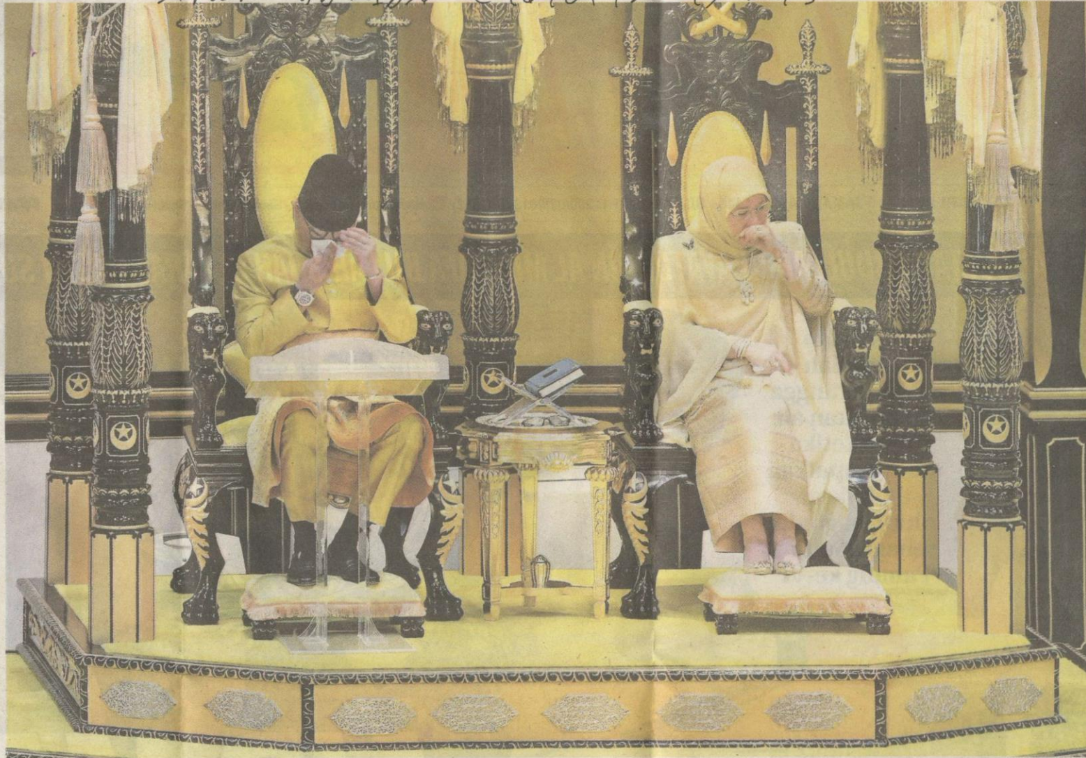
Al-Sultan Abdullah dan Tengku Puan Pahang, Tunku Azizah Aminah Maimunah Iskandariah menitiskan air mata ketika menyampaikan Titah Diraja pada Istiadat Pemasyhuran Sultan Pahang Keenam di Istana Abu Bakar, semalam.

"Saya memohon sekalian rakyat jelata menadah tangan ke hadirat Ilahi, memohon apalah sudi kiranya juga dilindungi dan dirahmati Ke