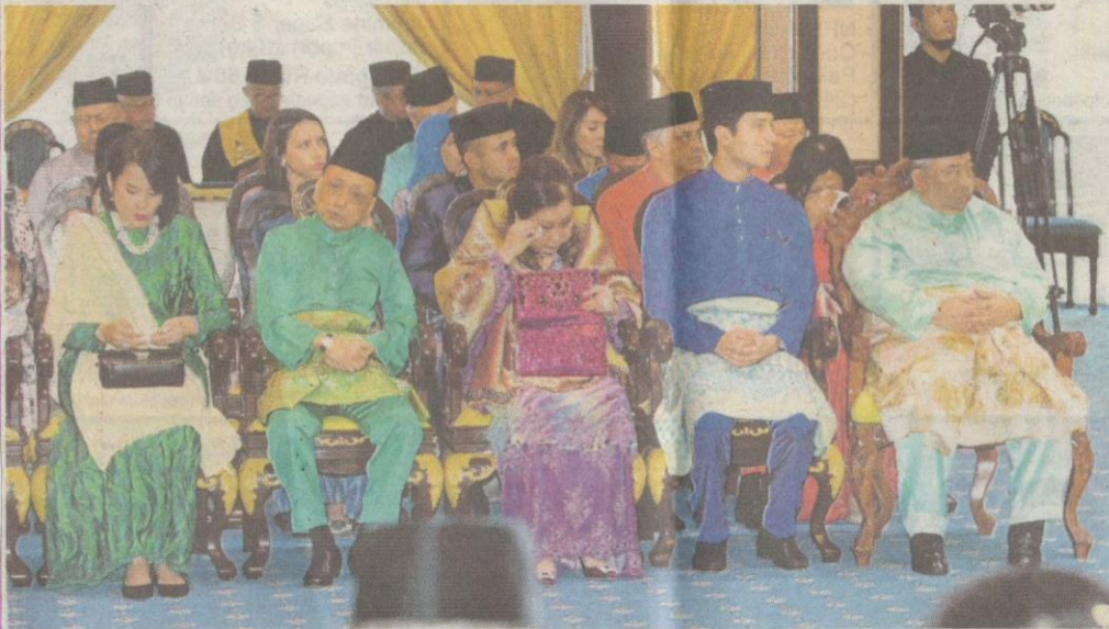
ANTARA kerabat diraja Pahang yang hadir pada Majlis Istiadat Pemasyhuran Sultan Pahang ke-6 di Balairung Seri, Istana Abu Bakar, semalam.

Abdul Razak Raaff dan Mohamad Azim Fitri Abd Aziz cnews@nstp.com.my