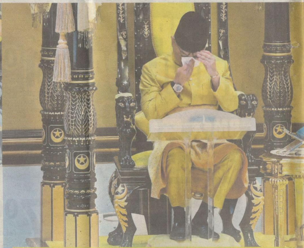
ISTIADAT PEMASYHURAN SULTAN PAHANG VI

Sementara itu, ditanya mengenai kebarangkalian baginda dilantik sebagai Yang di-Pertuan Agong (YDPA) ke-16 selepas pemasyhuran sebagai Sultan Pahang, baginda bertitah ia terletak kepada ketentuan Allah SWT dan menyerahkan sepenuhnya kepada keputusan yang akan dibuat Majlis Raja-Raja.