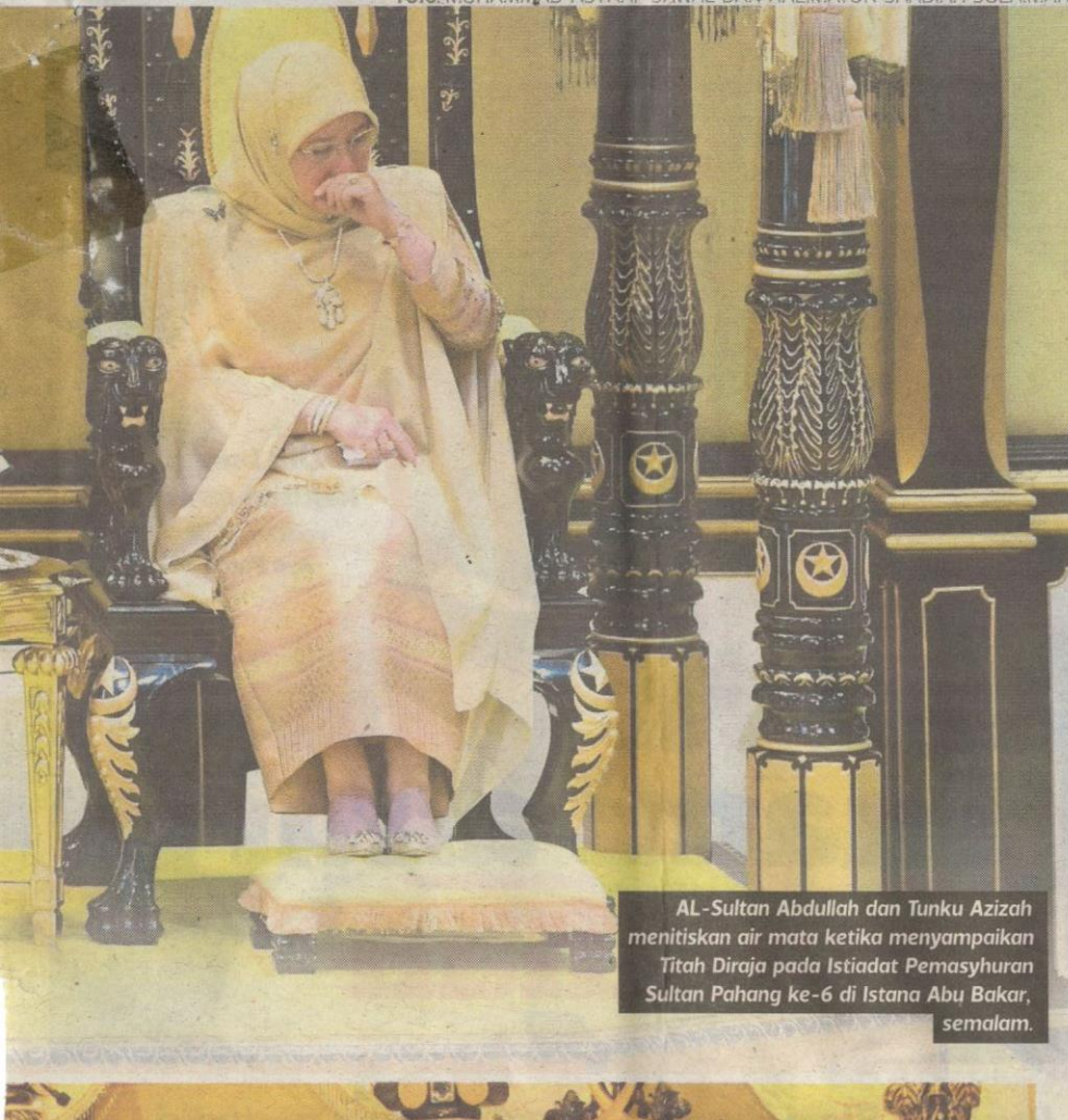
AL-Sultan Abdullah dan Tunku Azizah menitiskan air mata ketika menyampaikan Titah Diraja pada Istiadat Pemasyrhan Sultan Pahang ke-6 di Istana Abu Bakar, semalam.