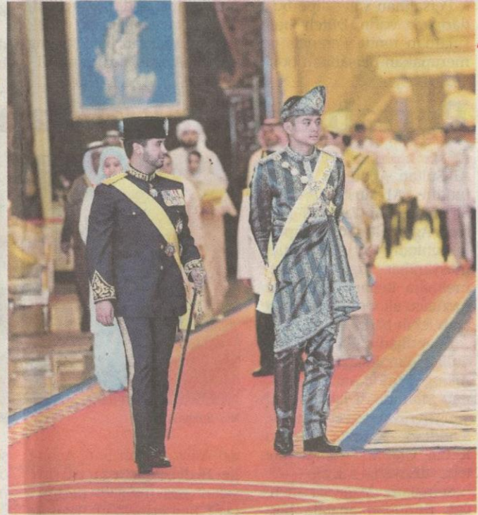
PEMANGKU Raja Pahang, Tengku Hassanal Ibrahim Alam Shah Al-Sultan Abdullah (kanan) dan Tunku Temenggong Johor, Tunku Idris Iskandar