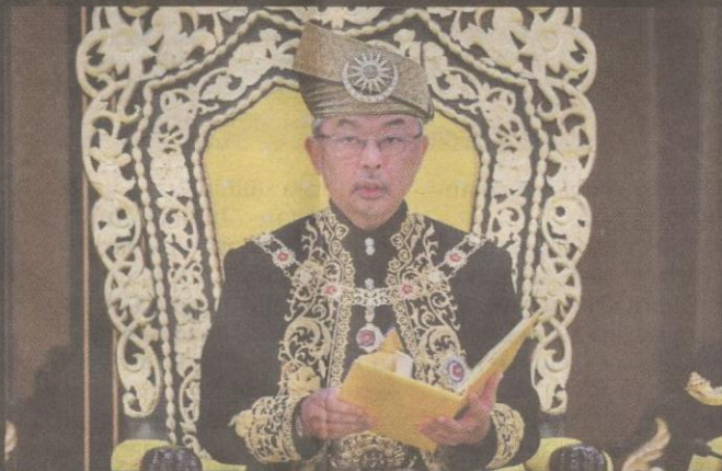
AL-Sultan Abdullah berkenan melafazkan Warkah Titah Diraja pada istiadat pertabalan baginda di Istana Negara, semalam.