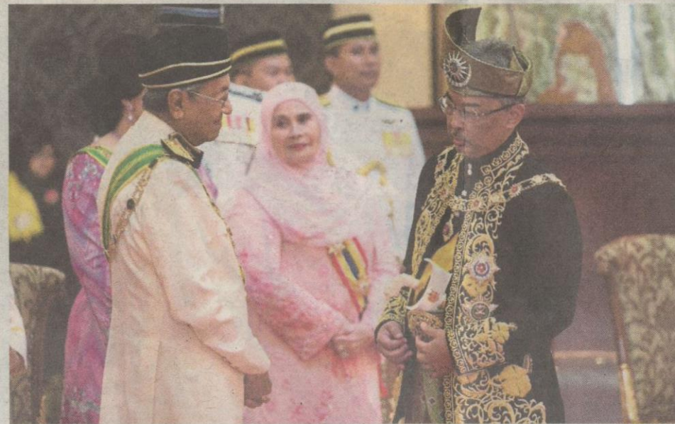
AL-SULTAN Abdullah beramah mesra dengan Dr Mahathir.

Kuala Lumpur: Kemakmuran bersama rakyat menjadi teras komitmen kerajaan diterajui parti Pakatan Harapan dalam merencana program dan dasar merealisasikan Malaysia sebagai negara maju, bermaruah dan merdeka.