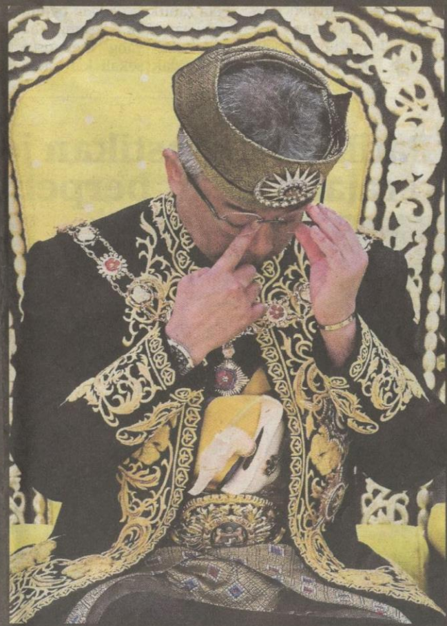
AL-Sultan Abdullah sebak ketika mengaminkan doa.