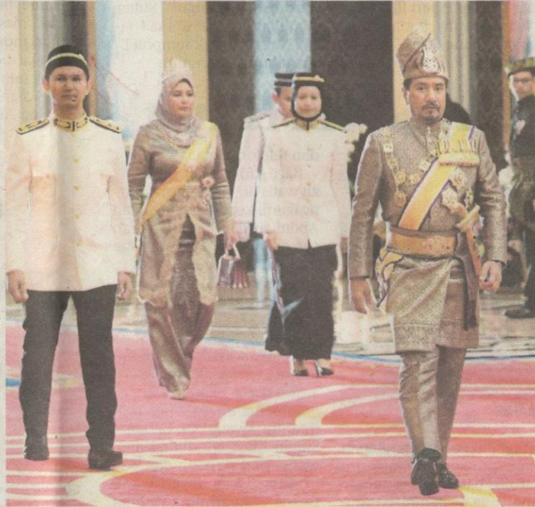
SULTAN Terengganu, Sultan Mizan Zainal Abidin bersama Sultanah Terengganu, Sultanah Nur Zahirah