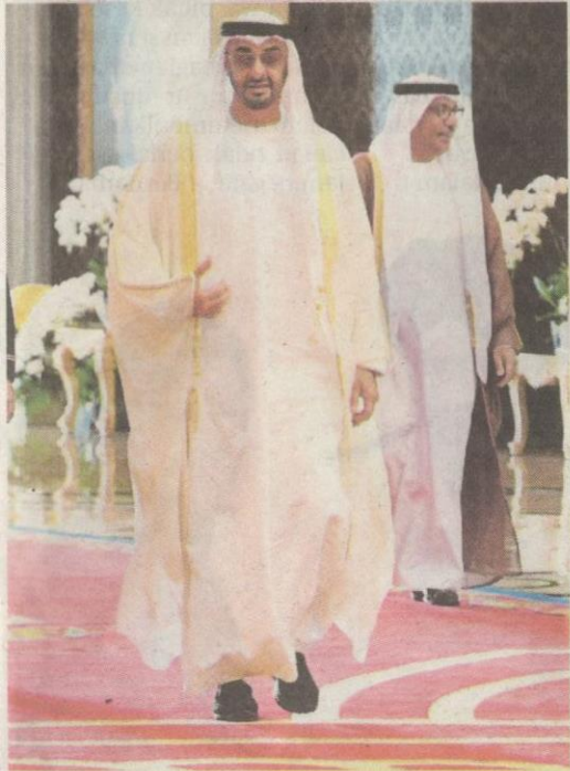
PUTERA Mahkota Abu Dhabi, Sheikh Mohamed Zayed Al Nahyan yang juga Timbalan Komander Tertinggi Anakatan Tentera Emiriah Arab Bersatu.