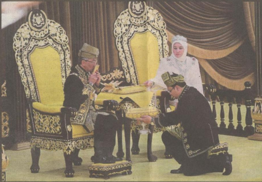
AL-Sultan Abdullah mengucup al-Quran yang merupakan lambang kemuliaan Islam sebagai agama rasmi negara.