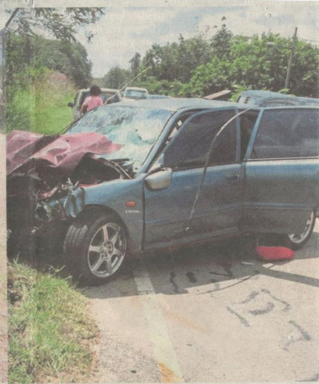
KEADAAN kenderaan yang terbabit kemalangan di Jalan Tanah Merah-Pasir Mas, dekat Bukit Tuku, Pasir Mas, semalam.