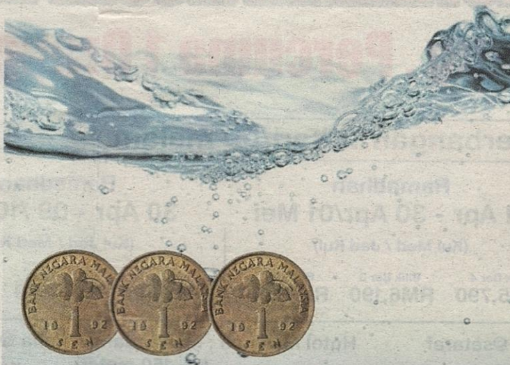
Singapura membayar sebanyak 3 sen untuk 1,000 gelen air mentah dari Malaysia.

Sinar Harian - 7/11/2020 (MIS 3) SHAH ALAM