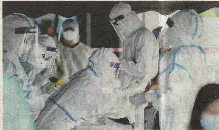
WHO mengiktiraf sistem kesihatan Malaysia dalam menangani pandemik Covid-19.

Beliau berkata, sehingga hari ini, masih tiada vaksin Co-