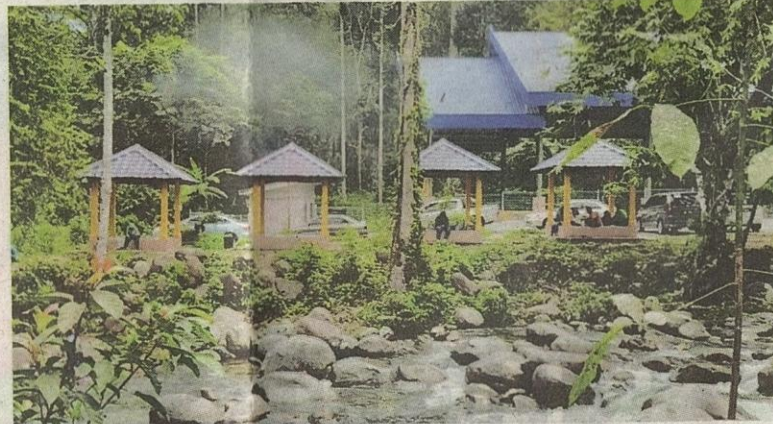
Kawasan Rekreasi dan Perkelahan Sungai Bil menjanjikan suasana alam semula jadi.

kawasan ini perlu dipulihara dengan baik supaya dapat dinikmati oleh generasi masa akan datang.