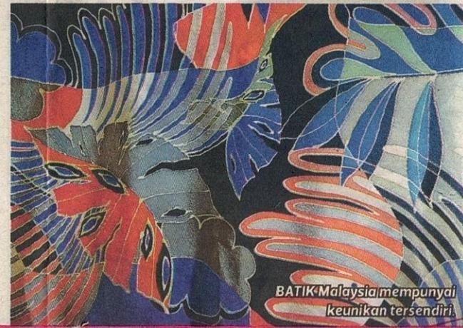
BATIK Malaysia mempunyai keunikan tersendiri.