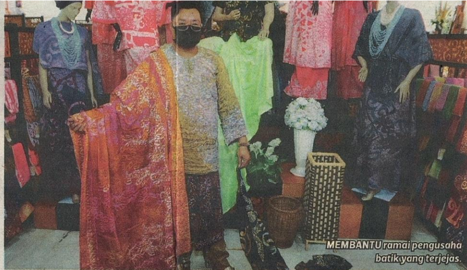
MEMBANTU ramai pengusaha batik yang terjejas.