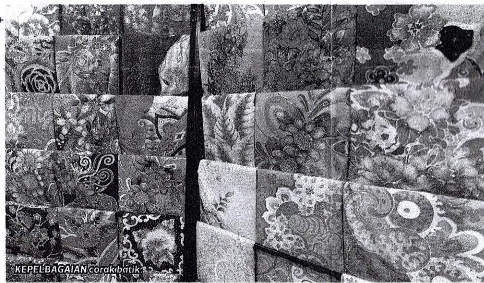
KEPELBAGAIAN corak batik

Hari Batik Malaysia semarak pemakaian seni kraf dalam kalangan Keluarga Malaysia