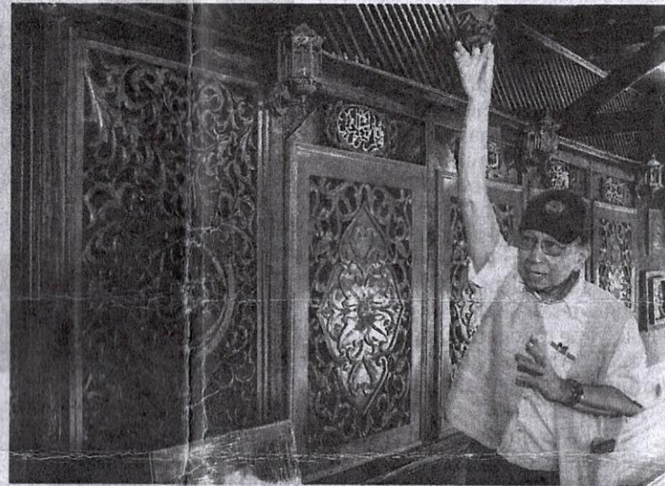
UKIRAN dinding mendapat sentuhan pengukir dari Siak dan Kelantan.