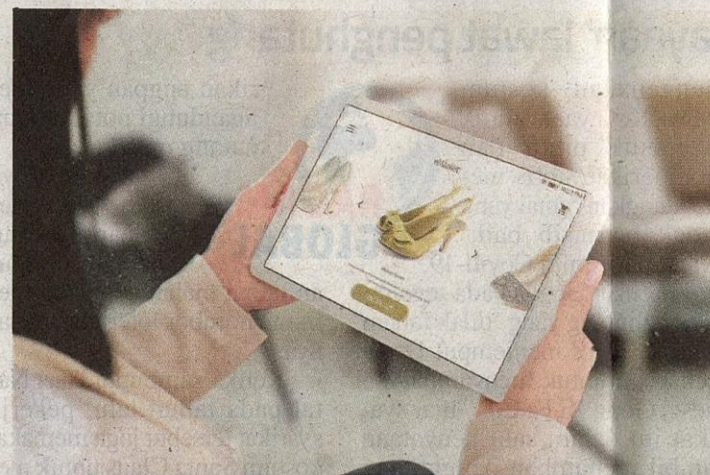
Membeli secara dalam talian menjadi trend baharu ketika pandemik Covid-19.

Teknologi digital perlu berada dalam kehidupan seharian kita hampir secara total! Ia selaras dengan hasrat Perbadanan Ekonomi Digital Malaysia (MDEC) yang menetapkan misi penting untuk menjadikan negara sebagai peneraju yang menerajui ekonomi digital menerusi naratif Malaysia 5.0.