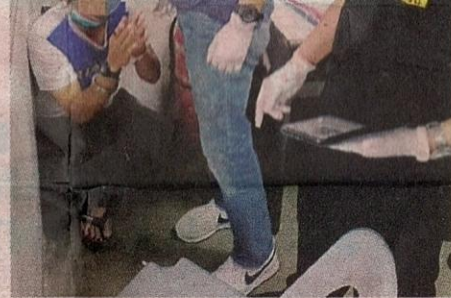
JPN sentiasa bekerjasama penuh dengan pelbagai agensi lain bagi membanteras penyalahgunaan MyKad palsu yang berleluasa dalam kalangan warga asing.

“Bagaimanapun JPN sentiasa bersikap terbuka terhadap sebarang cadangan untuk mempertingkatkan ciri-ciri kese-