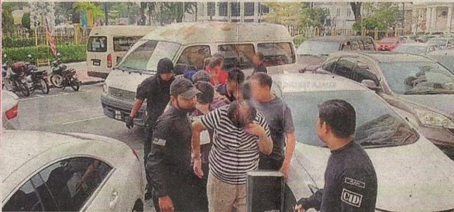
Seorang pegawai JPN Pulau Pinang dan seorang lelaki bergelar Datuk antara enam lelaki yang dihadapkan ke Mahkamah Sesyen Georgetown pada 12 September 2019, atas 32 pertuduhan melibatkan sindiket penjualan dokumen pengenalan diri dan sijil kelahiran kepada warga asing palsu dan diubah suai.

“Dan ketiga penglibatan sindiket dibantu kakitangan JPN sendiri membekalkan MyKad asli yang membabitkan pelanggaran integriti, penyalahgunaan kuasa dan penglibatan rasuah,” katanya kepada Sinar Harian baru-baru ini.