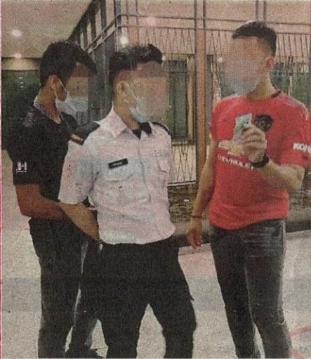
Antara warga Filipina yang bekerja sebagai pengawal keselamatan disyaki menggunakan kad pengenalan palsu ditahan JPN dalam Operasi Terancang dan Kutip di sekitar ibu kota pada Mei lalu.