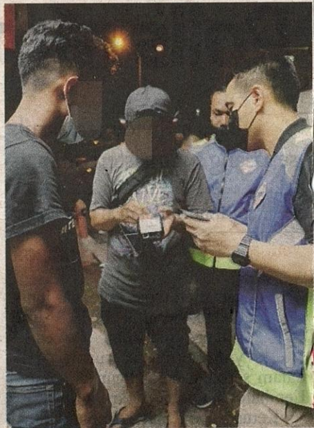
JPN melaksanakan operasi dalam usaha mengesan pelaku yang menyalahgunakan kad pengenalan.

“Orang ramai boleh membuat laporan atau menghubungi pihak berkuasa apabila mengetahui sesuatu penyalahgunaan dokumen berlaku,” katanya.