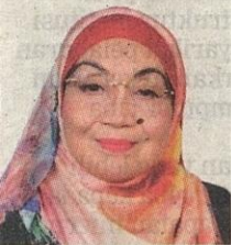
Dekan Fakulti Pendidikan Universiti Kebangsaan Malaysia

Satu hal yang perlu diakui, sistem pendidikan hari ini seharusnya didigitalkan selari dengan perkembangan dunia teknologi komunikasi ditambah pula dengan senario kehidupan semasa yang dihipit penularan pandemik COVID-19.