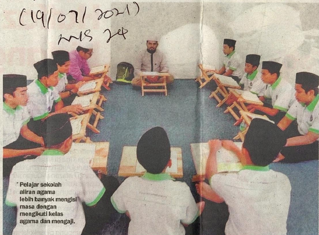
* Pelajar sekolah aliran agama lebih banyak mengisi masa dengan mengikuti kelas agama dan mengaji.

Memang ada pelajar yang memasuki tahfiz seawal umur 8 tahun dan mereka berjaya menghafaz 30 juzuk al-Quran setelah berumur 12 tahun. Namun begitu, ibu bapa perlu ingat bahawa hafaz al-Quran ini bukan mudah. Kena ada disiplin tinggi. Seperti yang saya cakap tadi, kena ikut kemampuan