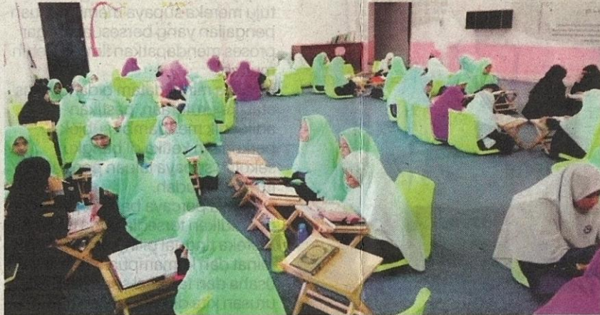
Bagi pelajar daripada aliran agama, rutin harian mereka sememangnya sentiasa padat dengan pengajian al-Quran.