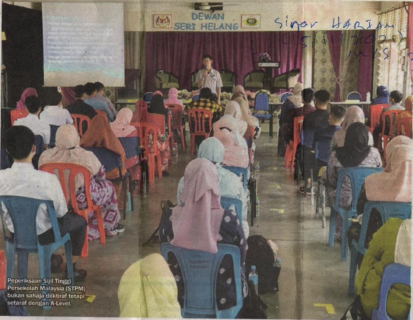
Peperiksaan Sijil Tinggi Persekolah Malaysia (STPM) bukan sahaja diiktiraf tetapi setaraf dengan A-Level.

➤ Apa yang penting adalah untuk KPM memastikan tenaga pengajar yang berkualiti terus berada dalam ekosistem pendidikan sekarang. Asas penyelidikan perlu diberikan kepada pelajar Tingkatan Enam supaya mereka lebih bersedia untuk menghadapi pengajian di peringkat yang lebih tinggi."