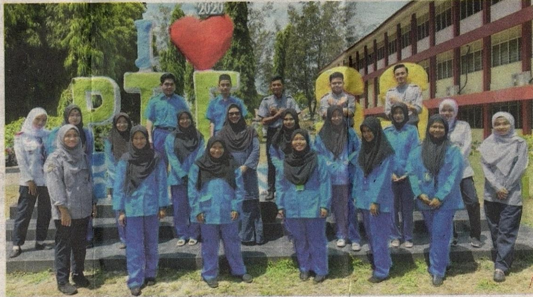
Sebahagian pelajar Tingkatan Enam, SMK Sultan Sulaiman, Kuala Terengganu.

Punya banyak kelebihan dan kekuatan yang tersendiri