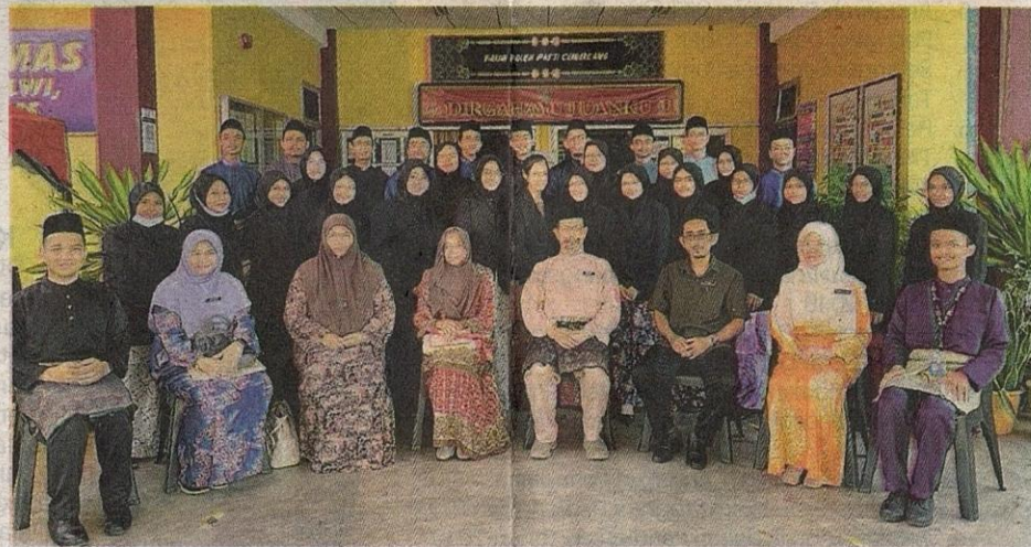
Pelajar dan guru Tingkatan Enam, SMK Syed Alwi, Perlis.