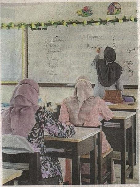
Penjenamaan semula Tingkatan Enam membolehkan pelajar berpakaian biasa ke sekolah.