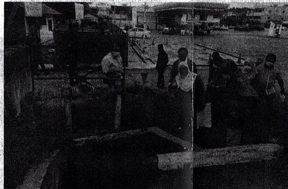
Sebagai seorang Pegawai Daerah, Suhaiza tidak ketinggalan turun padang untuk melihat sendiri masalah yang dihadapi penduduk setempat.