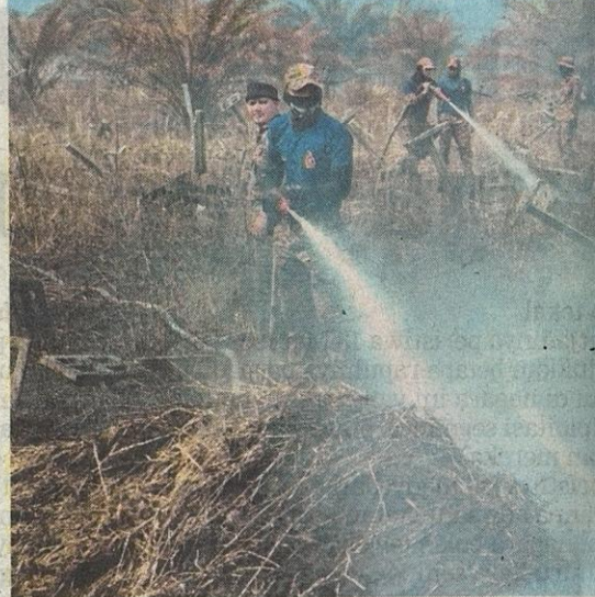
Anggota Bomba dan Penyelamat memadamkan kebakaran di Hutan Simpan Kuala Langat Selatan, Tanjung Sepat, semalam.

JAS juga telah menyediakan enam kertas siasatan, mengeluarkan satu kompaun dan empat notis arahan serta arahan di lapangan.