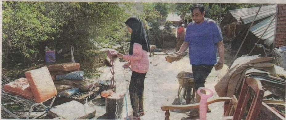
Penduduk Kampung Sungai Serai, Hulu Langat mula membersihkan kediaman masing-masing selepas banjir mulai surut ketika tinjauan pada Isnin.

Tinjauan Bernama di Batu 14 di sini mendapati, kebanyakan premis perniagaan di kawasan tersebut masih bersalut lumpur serta mengalami pelbagai kerosakan.