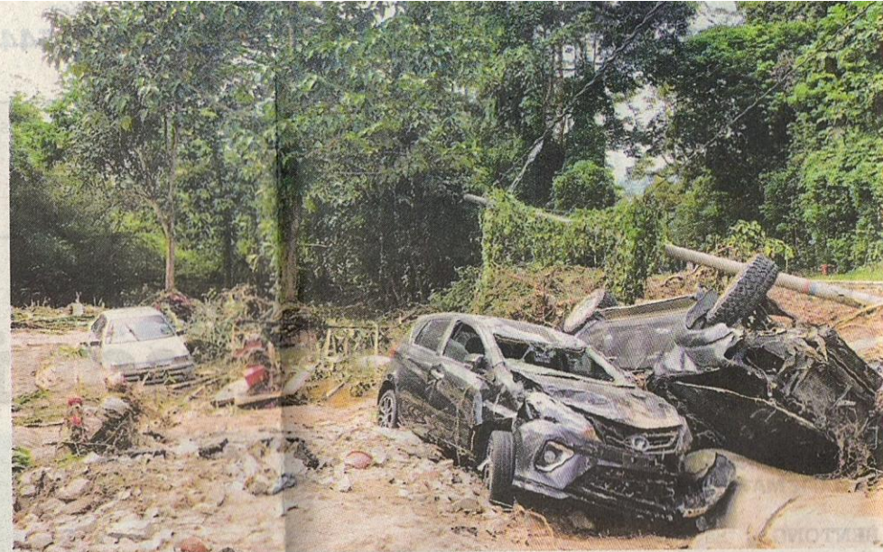
KEADAAN kereta yang dibawa arus banjir di Batu 18, Kampung Jawa, Hulu Langat semalam.

Air naik paras dada dalam 15 minit, rumah cuma tinggal tapak