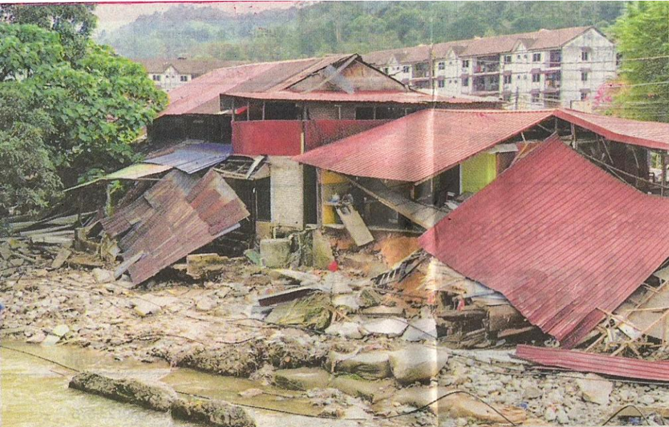
KEADAAN rumah seorang penduduk kampung yang rosak teruk akibat banjir pada Sabtu lalu.