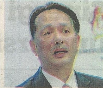
DR. NOOR HISHAM

Dari aspek transplan misalnya, pengunjung boleh mengetahui lebih lanjut mengenai proses itu di Malaysia serta pandangan dari perspektif agama.