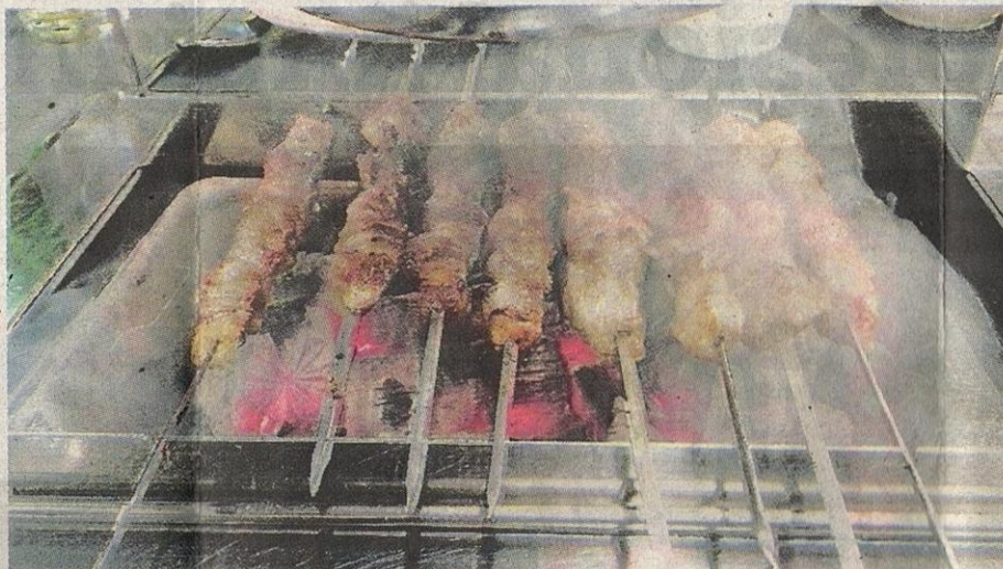
MEMASAK pada haba yang tinggi boleh merangsang pembentukan sel kanser dalam tubuh individu. - GAMBAR HIASAN

Landskap rawatan bagi kanser paru-paru yang berkembang pesat dengan rawatan lebih baharu membolehkan prognosis dan kualiti rawatan lebih baik diberikan.