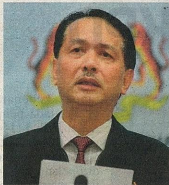
DR NOOR HISHAM

“Daripada jumlah kes baharu, 2,991 kes adalah penularan tempatan melibatkan 1,578 warganegara dan 1,413 bukan warganegara, manakala tujuh adalah kes import melibatkan tiga warganegara dan