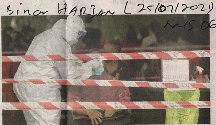
Petugas Kementerian Kesihatan Malaysia (KKM) mengambil sampel ketika menjalankan saringan Covid-19 terhadap peniaga dan pekerja di Pasar Besar Seremban pada Sabtu.

Beliau berkata, Selangor terus merekodkan jumlah tertinggi dengan 7,351 kes diikuti Kuala Lumpur (2,406), Kedah (867), Johor (804), Sabah (712), Melaka