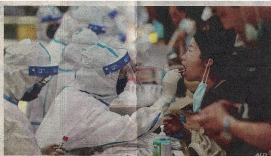
Kakitangan perubatan kesihatan melakukan ujian saringan besar-besaran Covid-19 di wilayah Jiangsu, China baru-baru ini.

Pemerintah tempatan di bandar raya yang dihuni oleh kira-kira 22 juta penduduk dan menempatkan kediaman Presiden China, Xi Jinping sebelum ini meraikan ulang tahun ke-100 Parti Komunis China yang diadakan pada 1