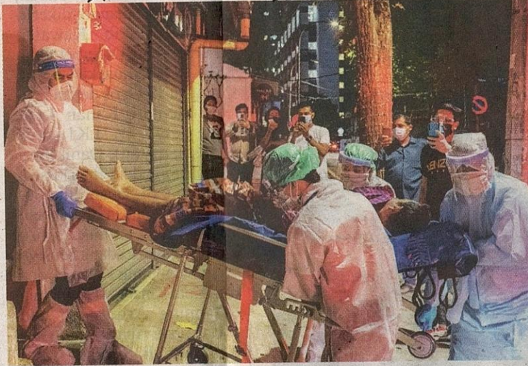
Petugas kesihatan Bulan Sabit Merah yang lengkap memakai peralatan perlindungan peribadi (PPE) membawa keluar seorang warga asing yang dipercayai menghidap Covid-19 untuk diberikan rawatan di kediamannya di sekitar ibu kota pada malam Selasa.

Kedah pula mencatatkan 1,371 kes diikuti Kelantan (1,003), Johor (1,162), Sabah (949), Pulau Pinang (867), Negeri Sembilan (800), Perak (662), Pahang (558), Melaka