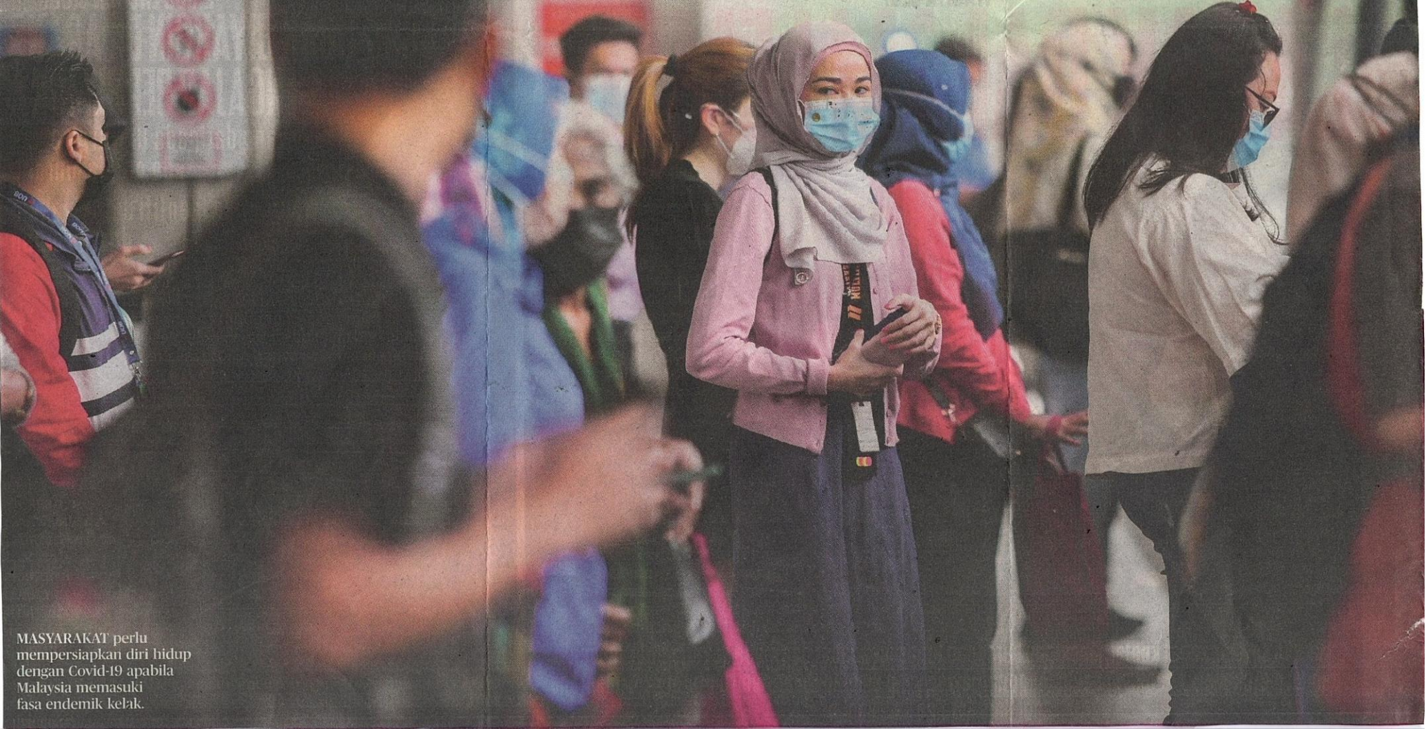
MASYARAKAT perlu mempersiapkan diri hidup dengan Covid-19 apabila Malaysia memasuki fasa endemik kelak.