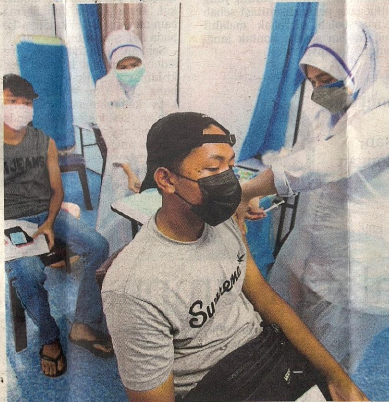
Orang ramai menerima suntikan vaksin dikendalikan petugas kesihatan di Klinik Kesihatan Sungai Bertek, Klang, semalam.

Bulan lalu, Dr Noor Hisham dilaporkan berkata, pemberian dos penggalak perlu kajian menyeluruh disebabkan vaksin yang diberi hanya mempunyai tindak balas imun bagi tempoh lapan bulan hingga setahun.