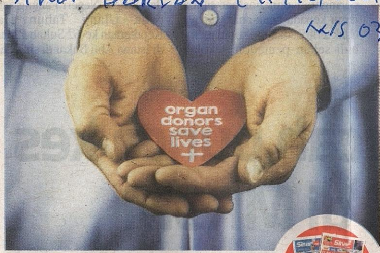
Amalan menderma organ boleh menyelamatkan nyawa pesakit yang memerlukan.