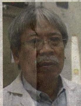
SAZALY ABU BAKAR

“Saya risau apabila kita terlampau fokus kepada Covid-19, kita lupa bahawa kita ada penyakit yang betul-betul endemik seperti leptospirosis, denggi dan cirit-birit,” katanya dan baik.