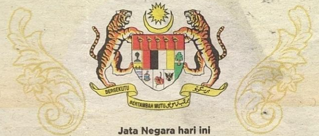
Jata Negara hari ini