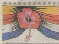
Bendera/ kain rentang