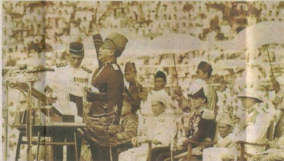
Pengisytiharan kemerdekaan Persekutuan Tanah Melayu yang pertama telah dibuat oleh Tunku Abdul Rahman Putra, Perdana Menteri Persekutuan Tanah Melayu tepat pada pukul 12.00 tengah malam di Padang Kelab Selangor, Kuala Lumpur.

Pada tahun 1511, Melaka jatuh ke tangan Portugis dan bermula dari tahun inilah Tanah Melayu berpada-pada.