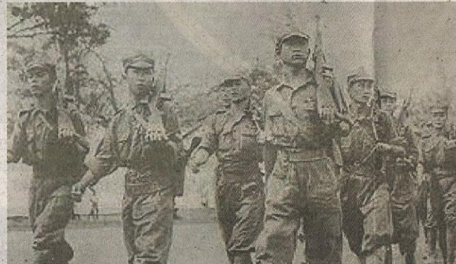
Parti Komunis Malaya (PKM) cuba untuk menguasai Tanah Melayu selepas pengunduran Jepun.