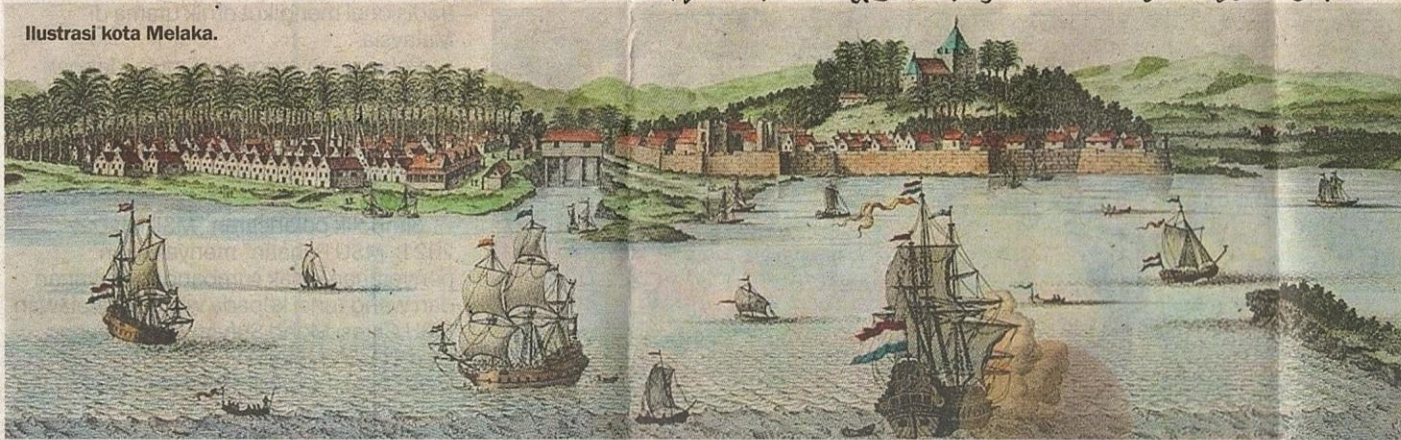
Ilustrasi kota Melaka.

Sejarah Malaysia bermula pada zaman Kesultanan Melayu Melaka iaitu sekitar tahun 1400 Masihi.