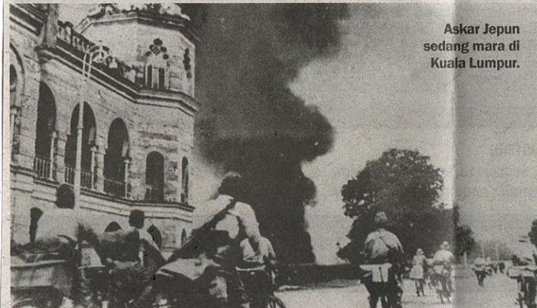
Askar Jepun sedang mara di Kuala Lumpur.