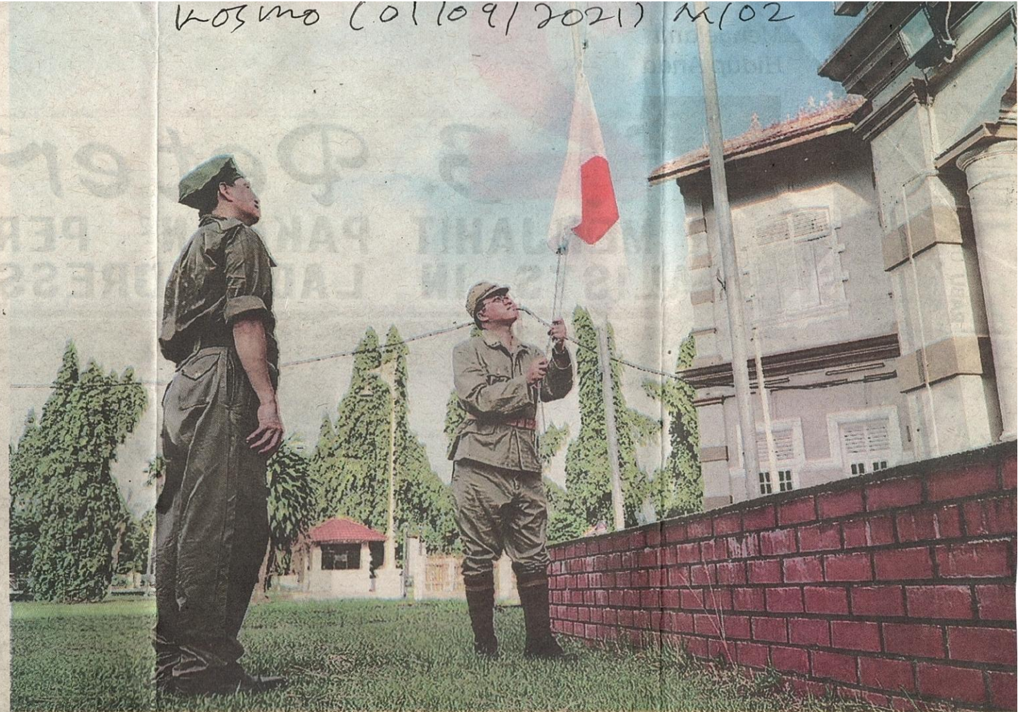
LAKONAN semula menunjukkan tentera Jepun menurunkan bendera negara itu di Tanah Melayu apabila kalah dalam Perang Dunia Kedua.