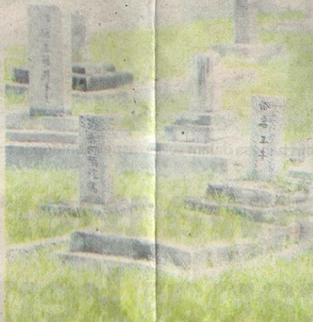
PERKUBURAN rakyat Jepun di Buntong, Perak.

perisik sebenar tetapi diberikan tugas untuk mengumpul maklumat-maklumat tertentu sepanjang menjalankan perniagaan.