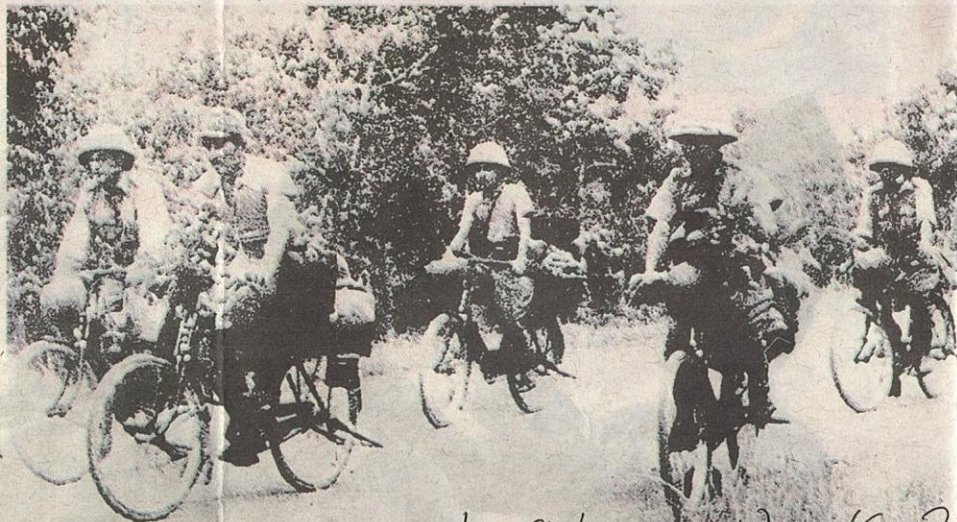
KOSMO (01/09/2021) m/s 21 JEPUN mula menyerang dan menjajah Tanah Melayu pada Disember 1941.

Selain Ipoh, perisikan ini turut dilaksanakan di Taiping, Batu Gajah dan Kuala Kangsar.