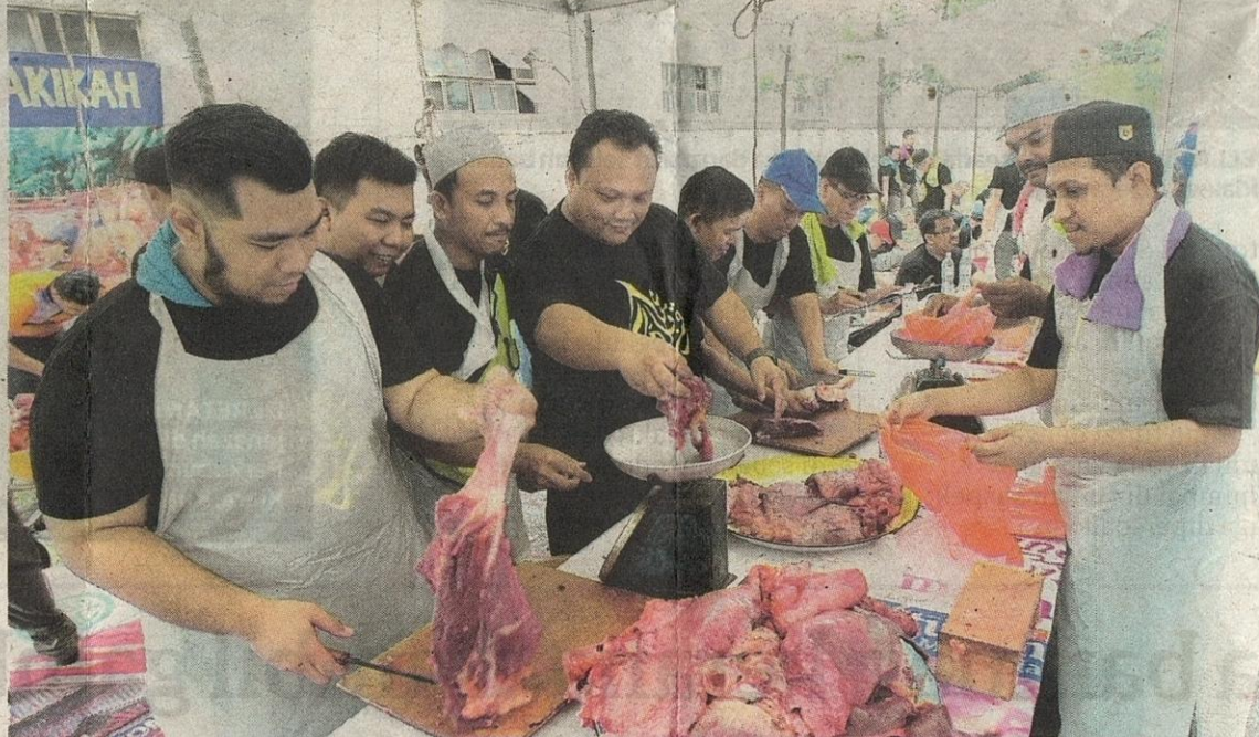
JANGAN ada yang mengambil kesempatan untuk menyorokkan bahagian tertentu daripada haiwan korban kerana ia adalah perbuatan yang haram. - GAMBAR HIASAN

Hal ini adalah bersempena sebuah hadis yang